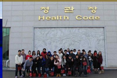
장학 - 체 학