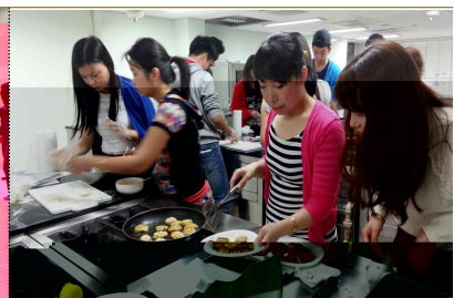
체험학 - 한국요 기