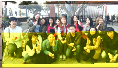
장학 - 학