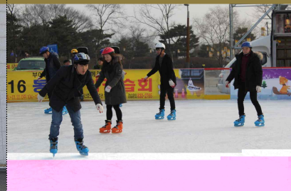
장학 - 동