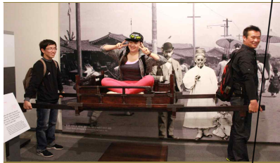
장학 - 국립중