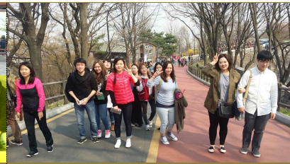
장학 - 학