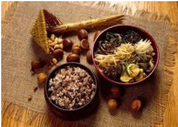
오곡밥과 묵은 나물