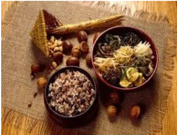
오곡밥과 묵은 나물