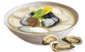
경남 통영 굴떡