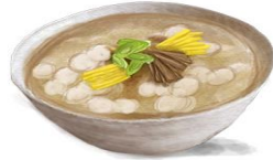
황해도 개성 조랭이 떡국