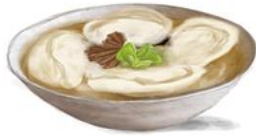
북부 지방 떡국

떡국에 굴을 넣어 먹는다. 바닷가 지역답게 멸치와 다시마를 우린 국물에 떡과 굴을 넣은 굴떡국으로 새해를 맞이한다.