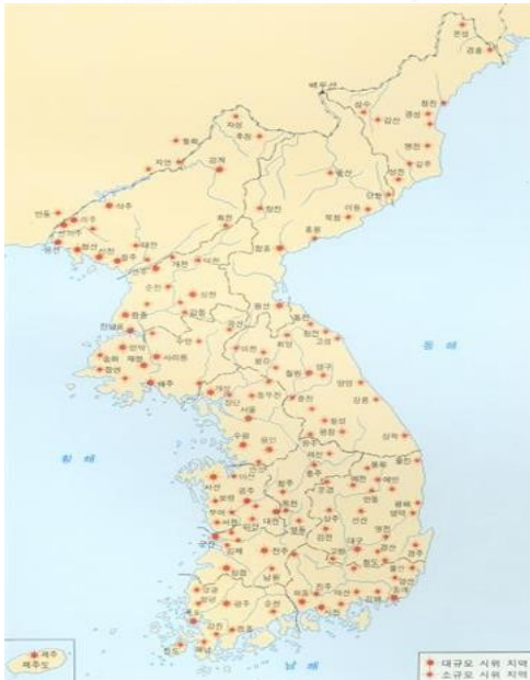
3·1 운동 봉기도 -전국적인 독립 운동이었음을 알 수 있다.

3·1 운동 이후 일제의 학살 장면. Robert L. Ward 라는 사업가가 찍은 사진이라고 하며, 미국 의회도서관에 소장되어 있다고 한다. 워싱턴 타임스 신문에 보도