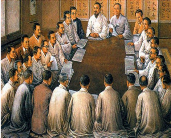
민족대표 33 인

1919 년, 3·1 운동으로 휴교령이 떨어지자, 당시 이화학당 학생이었던 유관순 열사는 함께 이화학당을 다니던 사촌 언니인 류예도와 함께 고향인 천안으로 내려와 만세 운동을 주도한다. 이것이 3·1 운동 중 '천안 아우내 만세 운동'(1919 년 양력 4 월 1 일, 음력 3 월 1 일)이다. 일본 헌병에 체포되어 서대문 형무소에서 1920 년 9 월 28 일 모진 고문을 이기지 못하고 만 17 살의 나이로 옥사하였다.