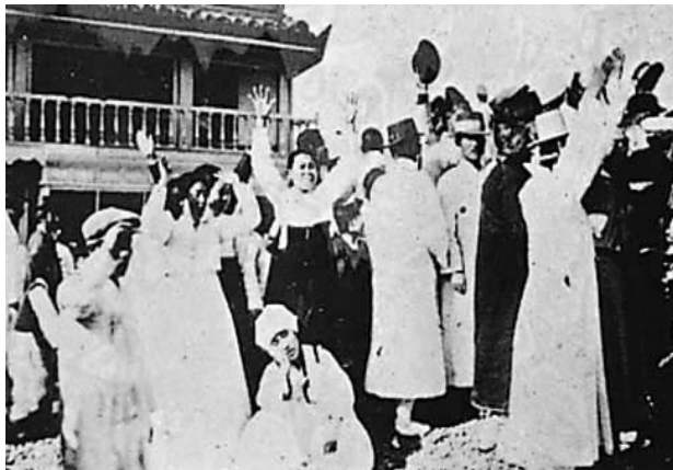
종로 탑골 공원에서의 만세 운동

고종의 독살설로 인하여 일본의 부당한 조선 점령과 폭력에 의한 통치에 대하여 많은 사람들이 반감을 갖게 되어 큰 호응을 얻을 수 있었다. 이 시위는 순수한 평화적 시위였으나 일본군은 이를 무력으로 진압함으로써 폭력화되었다. 약 3 개월 동안 지속된 3·1 운동은 박은식의 <한국 독립 운동 지혈사>에 의하면 3·1 운동에 참여한 인원은 약 200 만명, 7,509 명 사망, 15,850 명 부상, 45,306 명이 체포되었다고 말하고 있다.