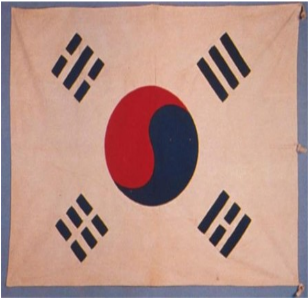
3·1 운동 당시 태극기