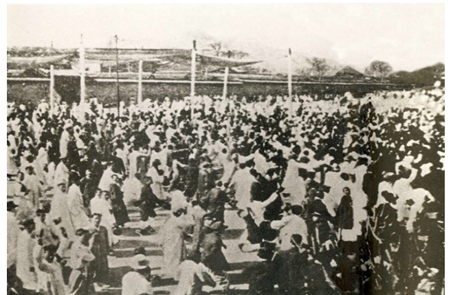
전국적으로 일어난 만세 운동