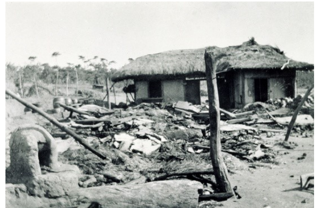
일본의 3·1 운동에 대한 보복으로 일어난 제암리 사건 일본은 마을 주민들을 교회에 몰아넣고 불태웠다.