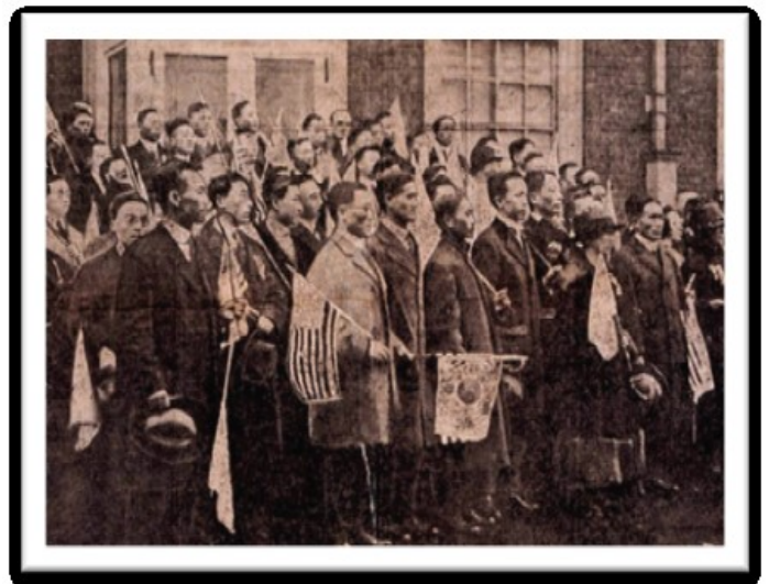
행진을 마치고 주 의회 의사당에 도착한 한인들