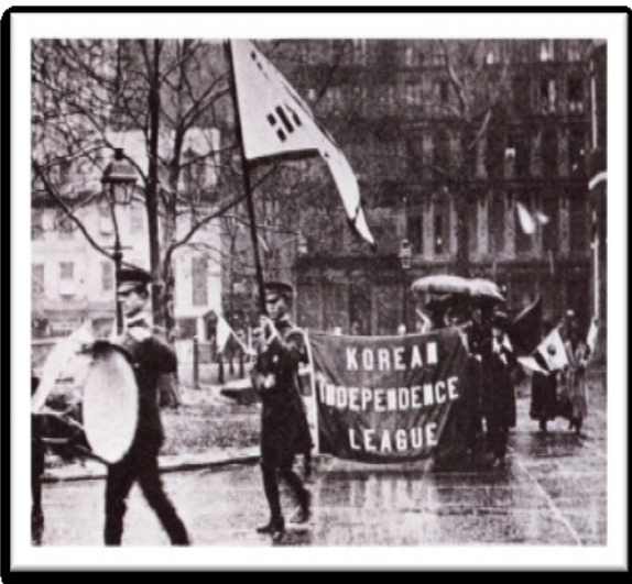
1919 년 4 월 한인자유대회 시가행진

1919 년 3·1 운동 소식을 듣고 미국에 사는 한국인들이 4 월 14 일~16 일 필라델피아에 모여 한인자유대회를 가졌다. 한국은 독립을 원하고 임시정부를 세웠다는 것을 세계에 알린 행사이다. 행사는 서재필 박사가 주도하셨고 안창호 의사도 참석하셨다.