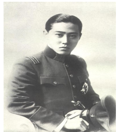
고종의 둘째 아들 의친왕 이강의 둘째 아들 이우왕자