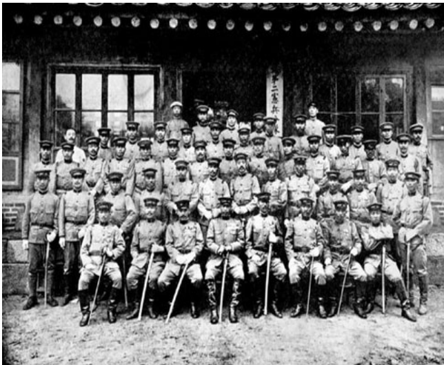
무단 통치기 일본 헌병 정치

병탄이란 단어에서 탄은 줌(삼킬 탄)으로, 일제에 의한 병탄 또는 「한국 강제 병합」 용어가 적합하다.