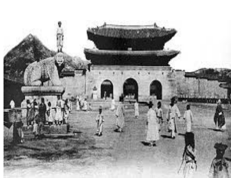
구한말 광화문 전경