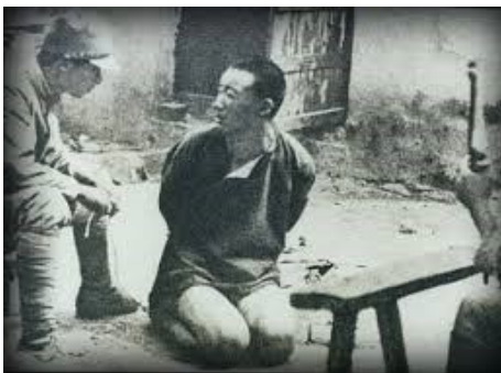
일제 강점기 시대의 일본 만행