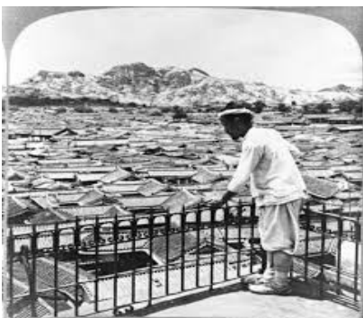
구한말 북촌 한옥들

d. 단발령(斷髮令) - 김홍집 내각이 고종 32 년인 1895 년 12 월 30 일(음력 11 월 15 일)에 공포한 성년 남자의 상투를 자르고 서양식 머리를 하라는 내용의 고종의 칙령이다. 그러나 신체발부는 수지부모라는 당대의 성리학자들의 격렬한 반발로 1897 년(건양 2 년) 일단 철회되었으나 외국에 다녀온 사람들이 많아지고, 선교사들, 그리고 교육을 통해 자연스럽게 퍼지게 되었다.