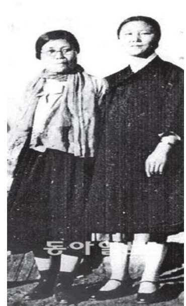
구한말 신여성은 선각자 독립 운동가 황애덕(왼쪽) 농촌 운동가 최용신(오른쪽) -심훈의 '상록수'의 모델