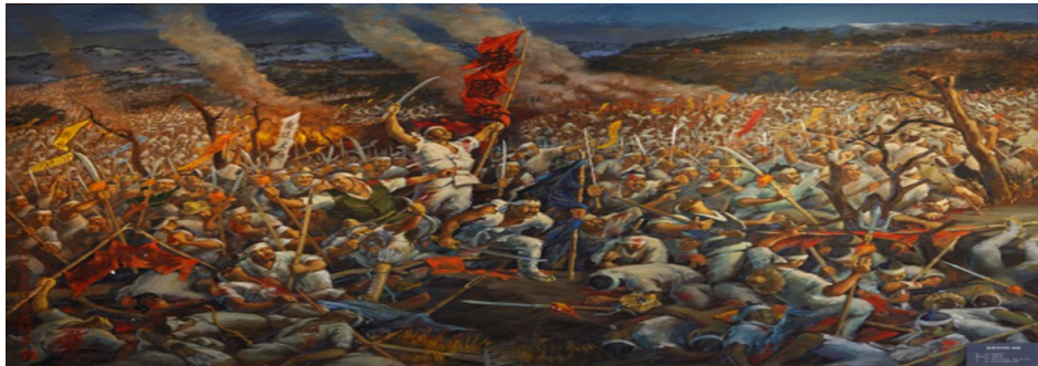
동학 농민 운동

d. 동학 농민 운동 (1894) - 탐관오리들의 행패에 대항해 동학 (현 천도교 의 전신) 세력이 주축이 되어 안으로는 정치와 사회 개혁을 추구하고 밖으로는 외세를 물리치려 일어난 민중운동이다. 처음에는 우세했으나 결국 관군과 일본군에 의해 진압되었다. 이 난을 진압하면서 청나라의 군대가 주둔하게 되고 일본은 기습적으로 침략하면서 청일전쟁이 일어나게 되었고, 일본의 한반도 침략이 본격적으로 시작되는 계기가 되었다. 조선 말기의 중요한 사건이자 동아시아사에서도 한반도의 세력 균형이 본격적으로 깨지기 시작한 계기가 된 사건이라는 점에서 중요하다. 즉, 세계사적 사건이다.