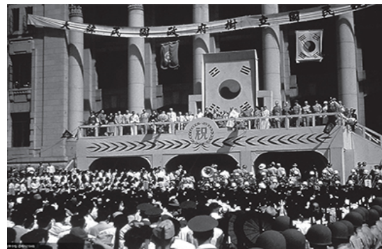
대한민국정부수립 경축식 태극기(1948)