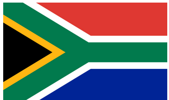
남아프리카 공화국 국기