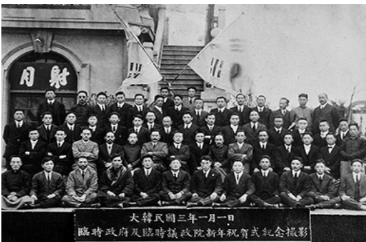
임시정부 · 임시의정원 신년축하식 (1921)