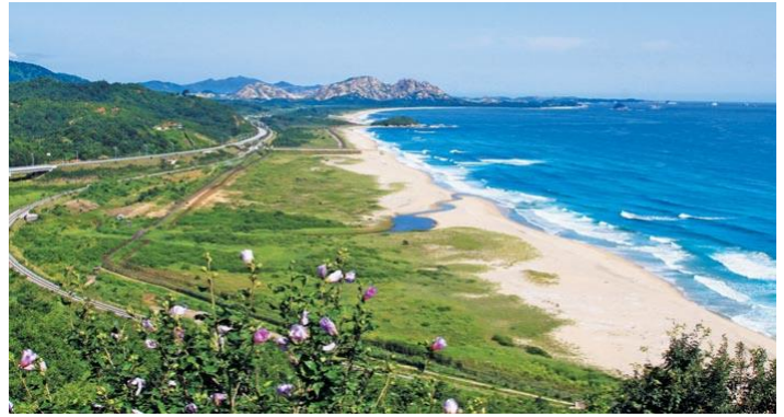
고성 통일전망대에서 바라본 금강산