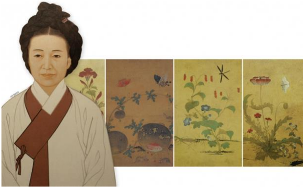
신사임당과 그의 작품