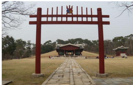
동구릉 내에 있는 문조의 수릉