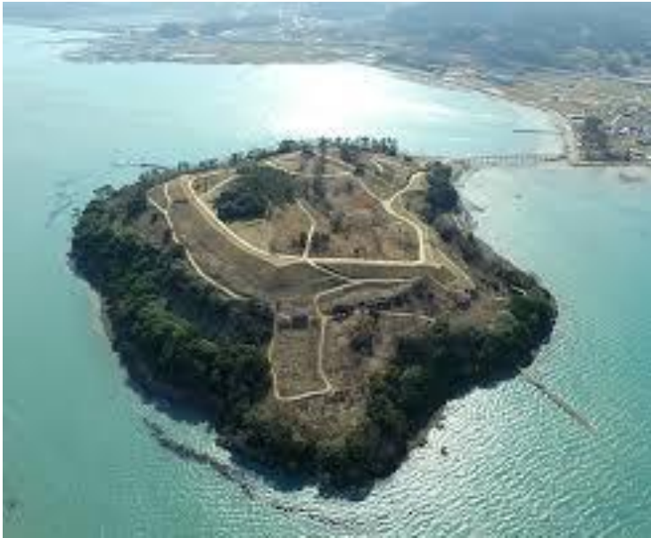
장도(일명 장군섬, 청해진 본영이 있던 곳)

-현재 섬 전체가 계단식 성의 형태로 흔적이 남아있으며, 앞바다를 제외한 주변바다는 수심이 얕아 방어용 목책을 박아 외부접근을 막도록 만들었는데 성터 안에는 토기와 기와조각이 발견되고 있고 인근에 장보고가 지었다는 법화사터가 남아있음