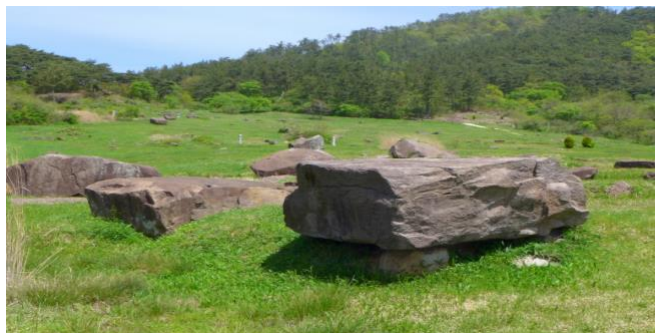
고창 죽림리 고인돌 군락(바둑판식)