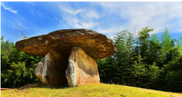
고창 도산리 고인돌(탁상식)